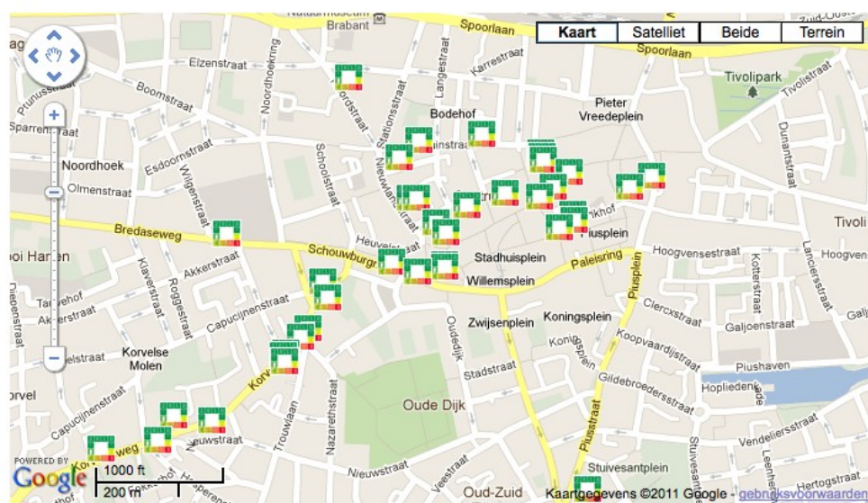
Afbeelding 3: http://www.tilburgwinkeltduurzaam.nl