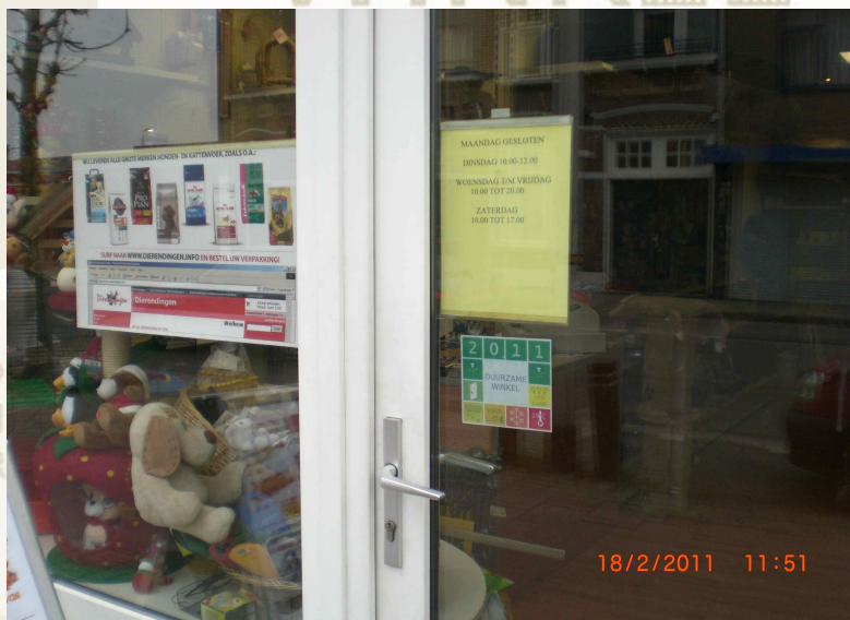
Afbeelding 1: Dierendingen - 18 februari 2011