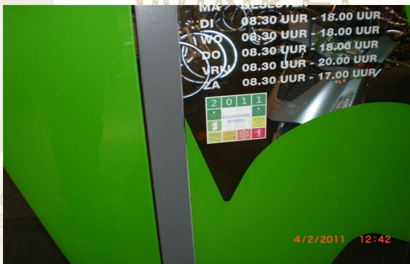
Afbeelding 2: Ton van de Klundert - 4 februari 2011

Opvallend is verder dat de nieuwste winkelcentra traditioneel zijn ingericht, met tl-verlichting en open deuren. Geen enkele winkel aan het nieuwe Pieter Vreedeplein behaalde het keurmerk. Daarentegen springen Paletplein, Tuinstraat en Korvelseweg eruit met een score van bijna 30 % keurmerken.